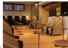
「写真はイメージです」

◎ご利用の際には、サービス対象のカードおよび当日の搭乗券または航空券(到着後ご利用の際は半券)のご提示が必要です。